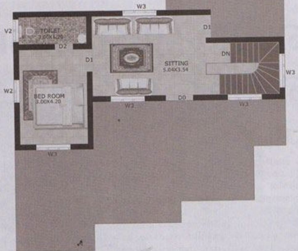
FIRST FLOOR PLAN-554 SQFT